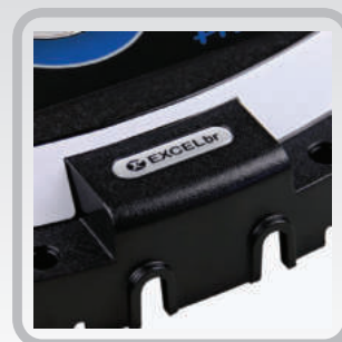
Suporte de proteção para saída das mangueiras