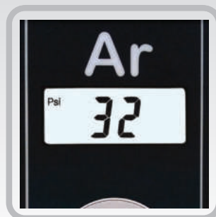
Visor de cristal líquido com iluminação interna