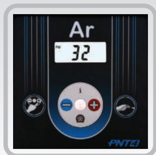
Calibrador digital de fácil operação

Ideal para a calibragem de pneus de carros, caminhões, ônibus, motos e bicicletas.