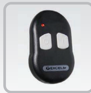
Control remoto para liberación gratuita