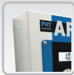
Gabinete de aluminio