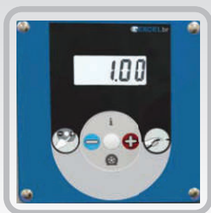
Calibrador digital fácil de operar

Ideal para la calibración de neumáticos de automóviles, camiones, autobuses, motos y bicicletas de forma rápida y segura.